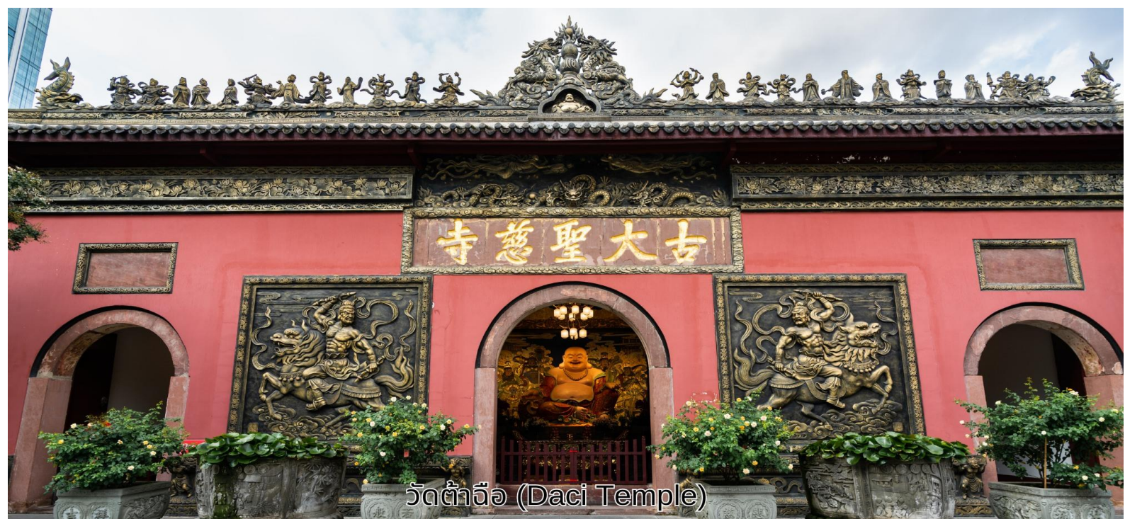
วัดต้าเจี๊ว (Daci Temple)

Chengdu ที่นี่ถือเป็นสถานที่สำคัญที่น่าสนใจ เพราะเป็นวัดที่พระถังซำจั๋งบวชเป็นพระภิกษุ ก่อนจะย้ายไปจำพรรษายังวัดอื่นภายในวัดต้าเจี๊วนั้นเงียบสงบ จากนั้นนำท่านสู่ ถนนคนเดินชุนชี่ลู่