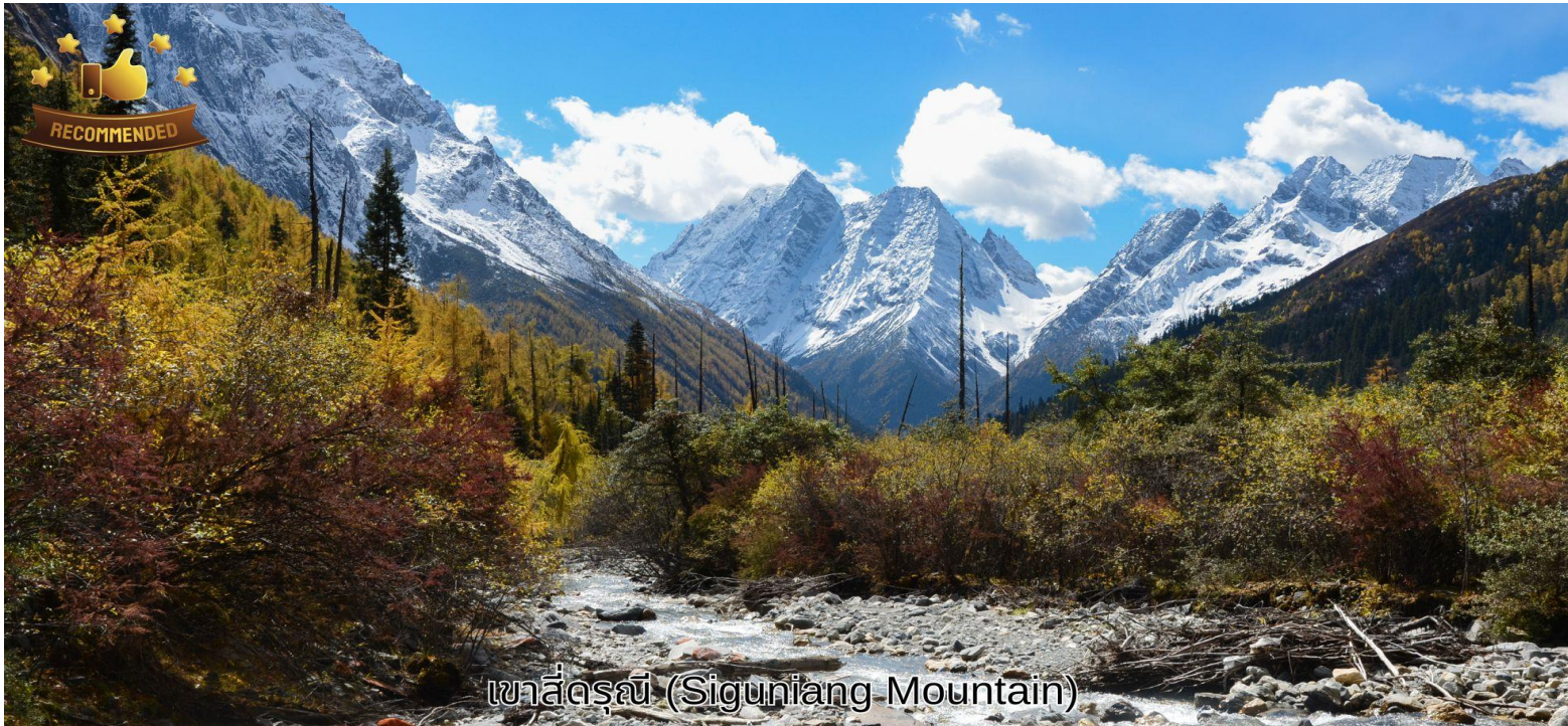
เขาสีดรุณี (Siguniang Mountain)