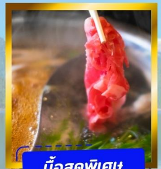
มือสุดพิเศษ