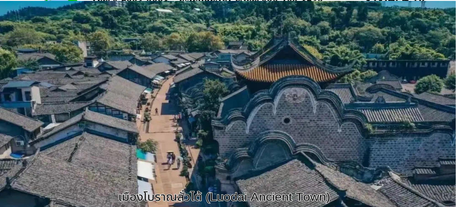
เมืองโบราณลั่วไต (Luodai Ancient Town)