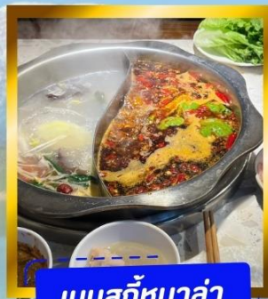
เมนูสุกี้หม่าล่า