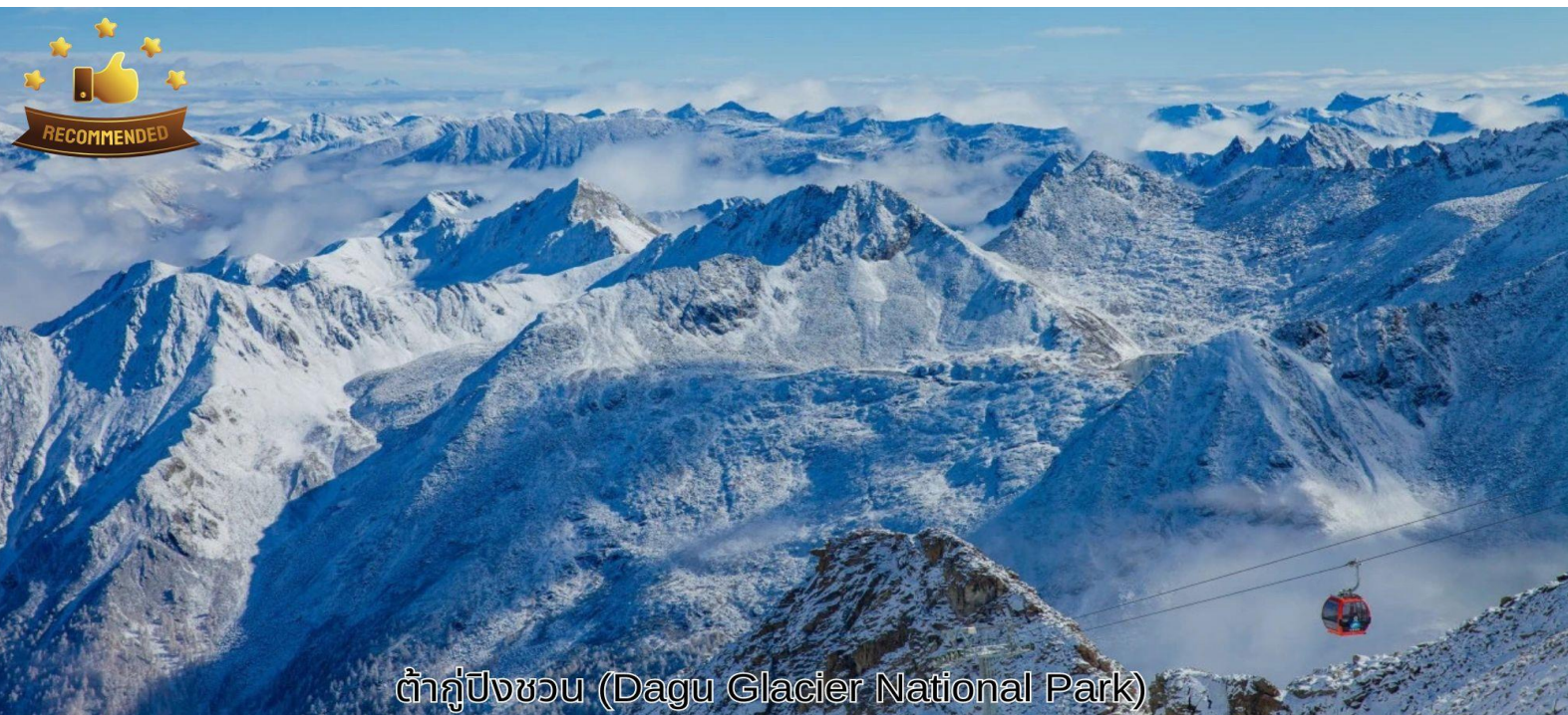
ด้ากู่ปังชว่น (Dagu Glacier National Park)

เช้า บริการอาหารเช้า ณ ห้องอาหารของโรงแรม